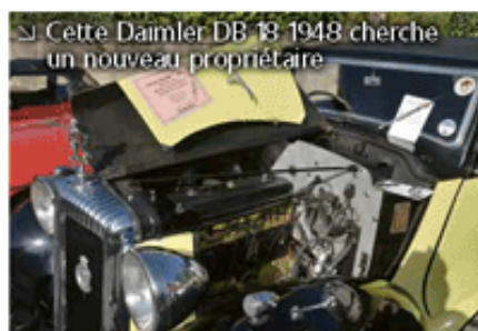
↳ Cette Daimler DB 18 1948 cherche un nouveau propriétaire