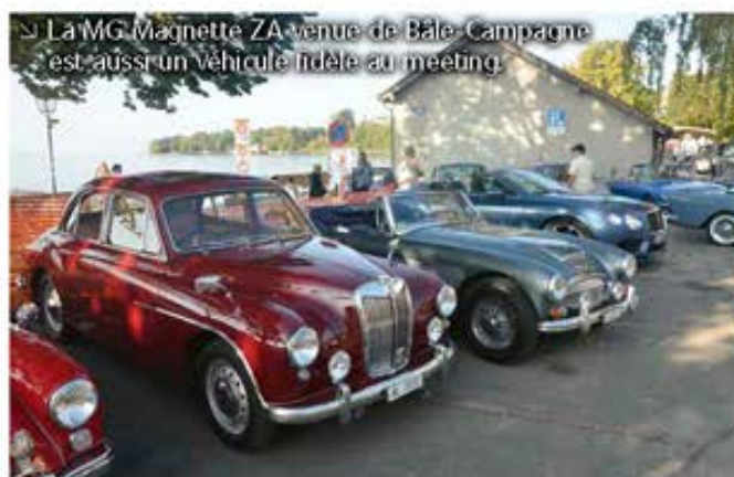
La MG Magnette ZA venue de Bâle-Campagne est aussi un véhicule fidèle au meeting.