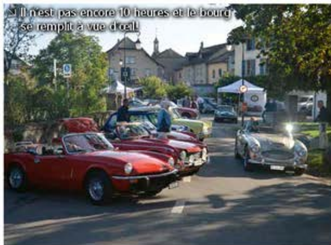
Il n'est pas encore 10 heures et le bourg se remplit à vue d'œil