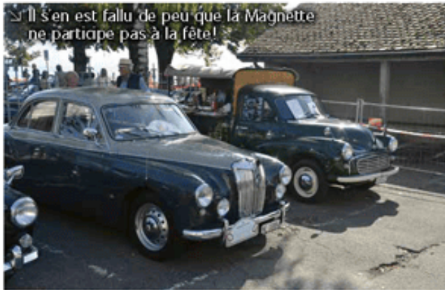
Il s'en est fallu de peu que la Magnette ne participe pas à la fête!

Cette année je suis franchement très heureux d'être venu avec ma MG Magnette ZB. Ce qui ne coulait pas de source. Car mercredi après-midi en descendant la rampe de son hangar, lorsque j'ai actionné la pédale de freins, rien ne s'est passé. J'ai donc tiré dans