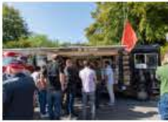
SCBCM St-Prex 2023 – Bifad'Oro propose de nombreuses spécialités portugaises.