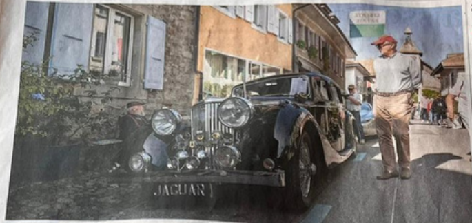
La classe de cette Jaguar (en haut) est bien mise en valeur par le cadre médiéval du bourg. Les quais (à g.) et les rues de Saint-Prex ont vu défiler un public nombreux, ravi et familial (à dr.).