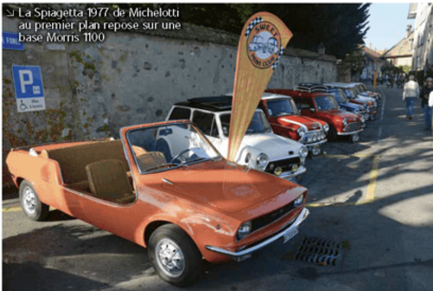
La Spiagetta 1977 de Michelotti au premier plan repose sur une base Morris 1100

l'urgence fortement sur le frein à main pour stopper ma course, heureusement sans dégâts matériels. Faisant au pas le tour du garage, je suis entré à l'atelier pour diagnostiquer l'origine du mal. Le cylindre de la roue arrière droite avait laissé fuir le liquide de freins... Membrane HS. Avec beaucoup de chance, un spécialiste MG sis à La Brévine m'a rassuré le jeudi matin lorsque je lui ai téléphoné. Oui, il avait en stock les cylindres de freins avec levier de commande des câbles de frein à main, les garnitures neuves car celle qui était totalement imbibée de liquide de freins pouvait se décoller sous peu et les deux cache-poussière de la commande des câbles. Avec les organes de sécurité, pas question de compromis. Je suis allé chercher ces pièces dans la foulée et en milieu d'après-midi l'auto était de nouveau apte au service! La bonne nouvelle est que cette mésaventure m'est arrivée dans un rayon local très réduit et pas lors de la descente d'un col pentu. Ouf!