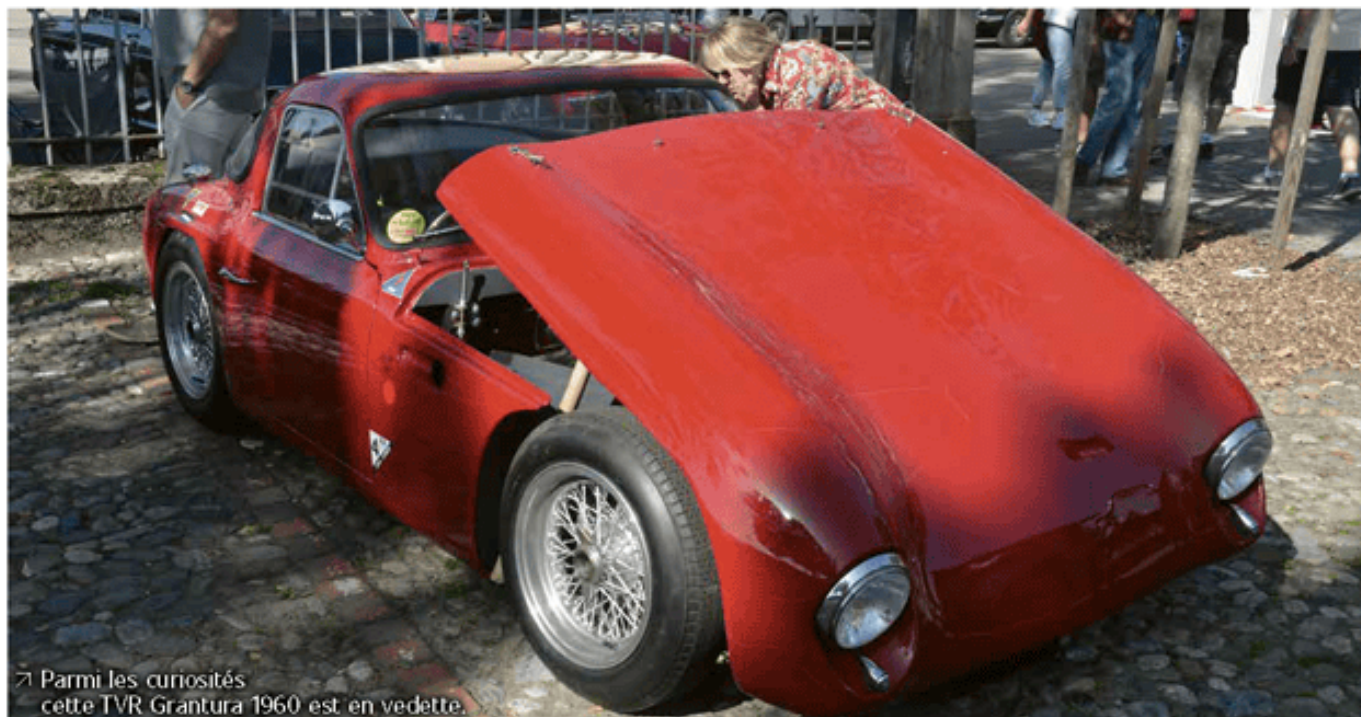
➤ Parmi les curiosités cette TVR Grantura 1960 est en vedette.

Un bilan très positif au terme de cette journée qu'il ne fallait manquer sous aucun prétexte. Rassurant, en ces temps où les véhicules thermiques sont voués aux gémonies, y compris ceux qui appartiennent au patrimoine.