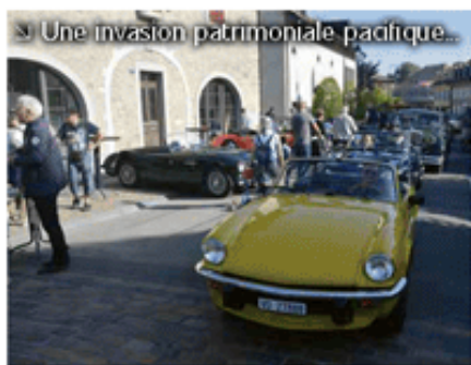
↳ Une invasion patrimoniale pacifique...