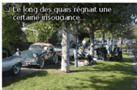
➤ Le long des quais régnait une certaine insouciance...