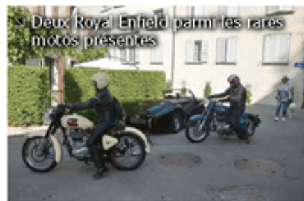
➤ Deux Royal Enfield parmi les rares motos présentes