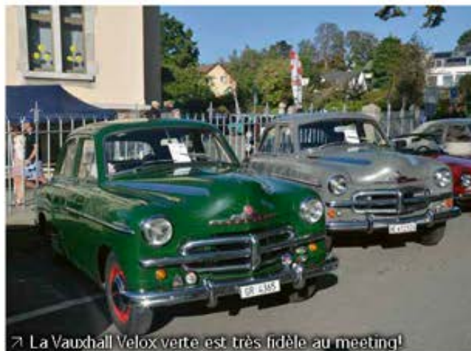
La Vauxhall Velox verte est très fidèle au meeting!