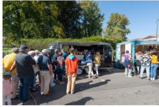
SCBCM St-Prex 2023 – Ici dégustation de cuisines espagnole et argentine – Swiss Classic British Car Meeting St-Prex.