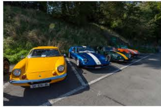
SCBCM St-Prex 2023 – Lotus Europa et également une Elan orange étaient présentes – Swiss Classic British Car Meeting St-Prex.

SCBCM St-Prex 2023 – Très belle Clubman découvrable du Mini Club de Colmar.