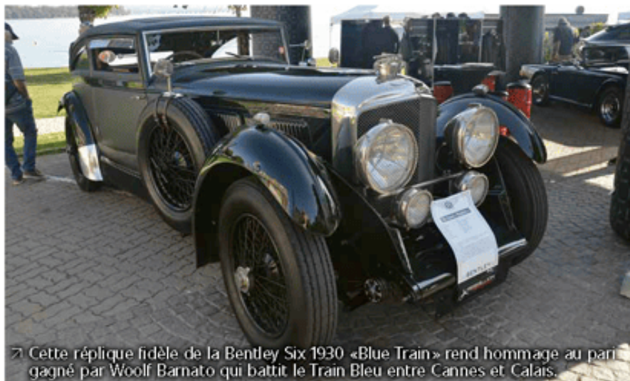
↳ Cette réplique fidèle de la Bentley Six 1930 «Blue Train» rend hommage au pari gagné par Woolf Barnato qui battit le Train Bleu entre Cannes et Calais.