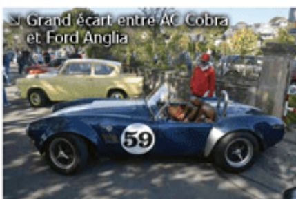
Grand écart entre AC Cobra et Ford Anglia