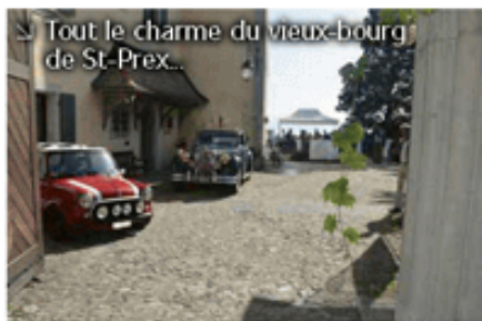
➤ Tout le charme du vieux-bourg de St-Prex...