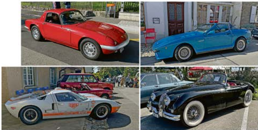
Sportsmen Est-ce qu'il n'y a que les Britanniques pour briller par une telle diversité de sportives? Lotus Elan, TVR 280i The Wedge (en haut, à g. et à dr.), Ford GT40 et «Grace», la Jaguar XK150 S de l'éditrice de la RA (en bas, à g. et à dr.).