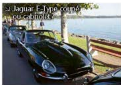
Jaguar E-Type coupé ou cabriolet?