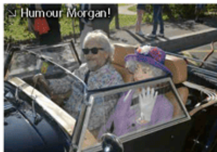
↳ Humour Morgan!