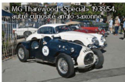
➤ MG Tharewood «Special» 1938/54, autre curiosité anglo-saxonne

A voir tant de sourires ce premier samedi d'octobre à St-Prex, au moins cette bourgade est favorable à vivre ensemble un jour de fête. Finalement, «Merci Morges, ce nouvel écrin est encore mieux!»