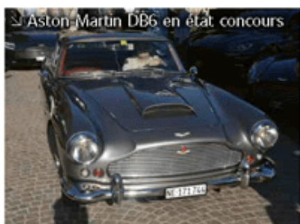
↳ Aston-Martin DB6 en état concours