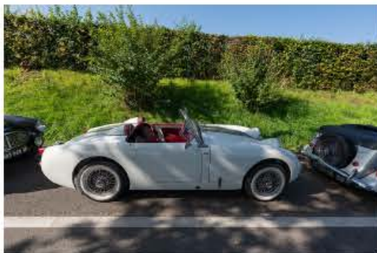
SCBCM St-Prex 2023 – Une très belle Austin-Healey ou MG Sprite, surnommée Frogeye à cause de ses phares – Swiss Classic British Car Meeting St-Prex.

Le Swiss Classic British Car Meeting 2023 a pour but de célébrer les voitures classiques britanniques . Cette année, les voitures participantes sont également composées d'une grande variété de modèles modernes. Cela amènera sans doute l'organisation à repenser la définition du terme Vintage qui regroupe des véhicules de plus de 30 ans. L'augmentation du nombre de voitures exposées nécessitera également une réflexion sur la manière de mettre en valeur chaque modèle et chaque marque, tout en préservant l'esprit de l'événement.