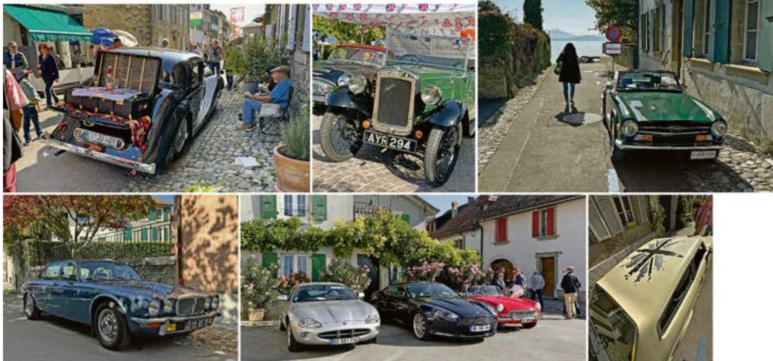
Ambiance Les ruelles pittoresques ont créé une bonne ambiance, tout comme les quelque 1300 voitures classiques et plus de 10000 visiteurs. La diversité était unique: Jaguar Mk IV, Austin Seven classique, Triumph TR6 (ci-dessus à g.), Daimler Double Six S2, Jaguar, Aston Martin ainsi que MG et Reliant Scimitar avec l'Union Jack (en bas).

admirer les centaines de vieilles voitures. A St-Prex, toutes les autos semblaient profiter de places VIP. À commencer par les voitures garées sur la magnifique promenade au bord du lac, réservée à la marque au «leapers». Mais toutes les allées et les ruelles offraient un véritable écrin aux vieilles voitures, qui semblaient caressées par le soleil, installées dans un arrière-plan fait de maisons au style classique. Même la voiture qui se retrouvait isolée dans une ruelle latérale devenait une expérience pour les visiteurs, une sorte de jeu de pistes. Ainsi, comment imaginer meilleur sujet pour l'album-souvenir que cette Triumph TR6 solitaire garée quelque part dans une ruelle avec vue sur le lac? On y reviendrait bien volontiers un jour afin d'y immortaliser sa propre voiture.