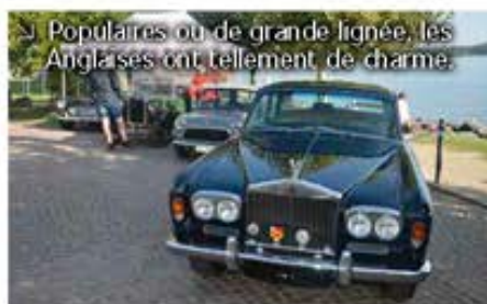
Populaires ou de grande lignée, les Anglaises ont tellement de charme.