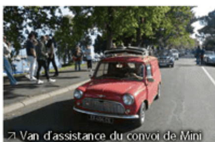
➤ Van d'assistance du convoi de Mini