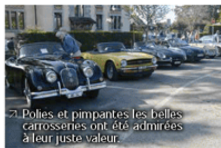
Polies et pimpantes les belles carrosseries ont été admirées à leur juste valeur.