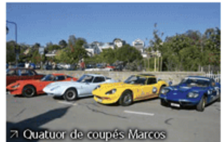
Quatuor de coupés Marcos