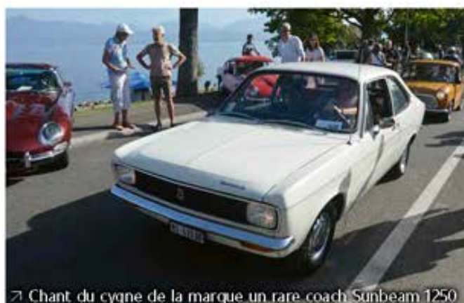
Chant du cygne de la marque un rare coach Sunbeam 1250