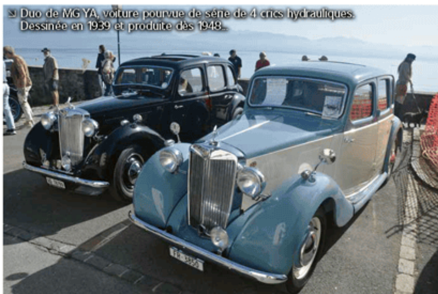
➤ Duo de MG YA, voiture pourvue de série de 4 crics hydrauliques. Dessinée en 1939 et produite dès 1948.