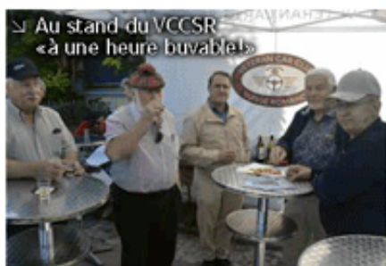
↳ Au stand du VCCSR «à une heure buvable!»