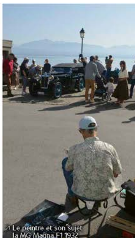
Le peintre et son sujet la MG Magna F1 1932