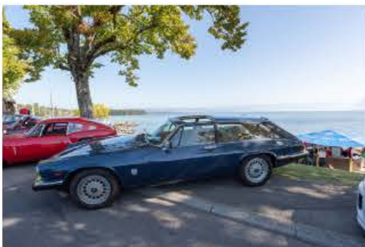
SCBCM St-Prex 2023 – Très rare Jaguar XJS Eventer Lynx – environ 67 produites – fabriquée à la main – Swiss Classic British Car Meeting St-Prex.

L'organisation du Swiss Classic British Car Meeting 2023 a suscité un engouement très positif des Saint-Preyards. Malgré quelques désagréments liés à la nécessité de vider le bourg pour accueillir la manifestation, aucun problème majeur n'a été signalé. Tous les habitants ont joué le jeu et se sont montrés compréhensifs . Le syndic de la commune s'est déclaré très satisfait de la journée et de l'affluence qu'elle a générée, avec environ 14 000 visiteurs présents . Comparé à l'édition précédente à Morges, qui avait attiré 10 000 personnes, cette augmentation de la fréquentation est un réel succès.