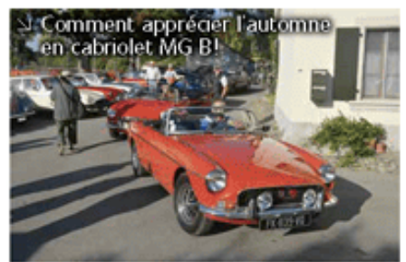
Comment apprécier l'automne en cabriolet MG B!