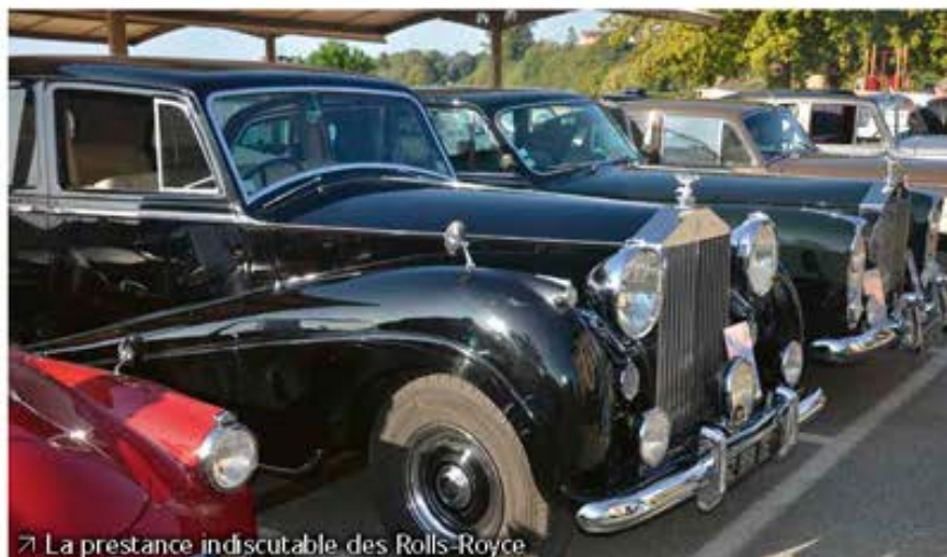
La prestance indiscutable des Rolls-Royce