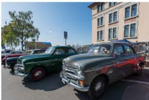
SCBCM St-Prex 2023 – Vauxhall Velox – 1951-1954 – version EIP, 4 cylindres ou EIPV, 6 cylindres – Swiss Classic British Car Meeting St-Prex.

L'équipe organisatrice du Swiss Classic British Car Meeting 2023 a été accueillie à bras ouverts par les membres de la municipalité de Saint-Prex . Toutefois, s'est posé le problème de l'espace disponible pour l'exposition des véhicules. Cependant, grâce à une organisation minutieuse, il a pu être possible de ranger le même nombre de voitures qu'à Morges, soit environ 1300 à l'intérieur et d'autres aussi sur le parking extérieur. Les autos ont été parkées dans l'ordre d'inscription . Pour des raisons de sécurité, les inscriptions ont dû être clôturées. En effet, la sécurité des participants était une priorité absolue, notamment en cas d'incendie ou de maladie. Cette première édition à Saint-Prex a été un test réussi . La police s'est montrée très satisfaite de l'événement. Cela ouvre des perspectives pour l'année prochaine en termes d'agrandissement de l'espace d'exposition.