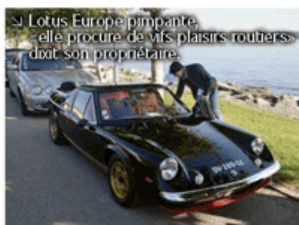
↳ Lotus Europe pimpante, «elle procure de vifs plaisirs routiers» dit son propriétaire.