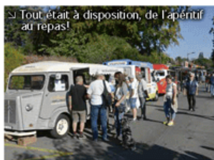
↳ Tout était à disposition, de l'apprentif au repas!