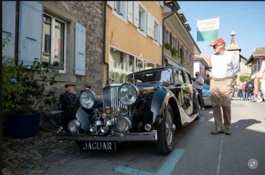
La classe de cette magnifique Jaguar est bien mise en valeur dans le cadre du village médiéval de Saint-Prex. Marie-Lou Dumauthioz

Le moteur d'une Aston Martin ronronne dans la file d'anciennes voitures anglaises au chemin des Colombettes, à Saint-Prex, décoré de drapeaux britanniques pour l'occasion. «C'est complet», s'exclame un membre du staff chargé de contrôler le QR code des pilotes venus exposer leur engin au British Car Meeting 2 , victime de son succès dès le matin. Jamais autant de voitures n'auront stationné dans la commune. Après avoir eu lieu à Morges pendant trente ans, le show était organisé pour la première fois dans ce village médiéval au bord du lac.