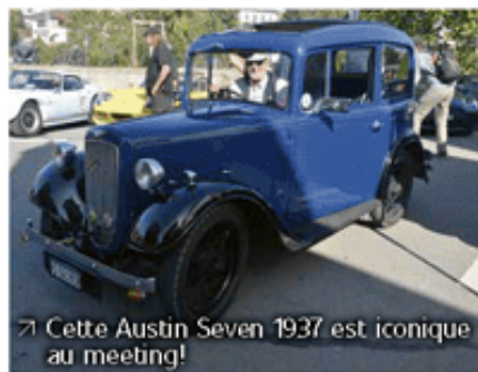
↳ Cette Austin Seven 1937 est iconique au meeting!